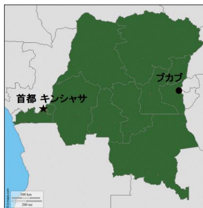
コンゴ民主共和国